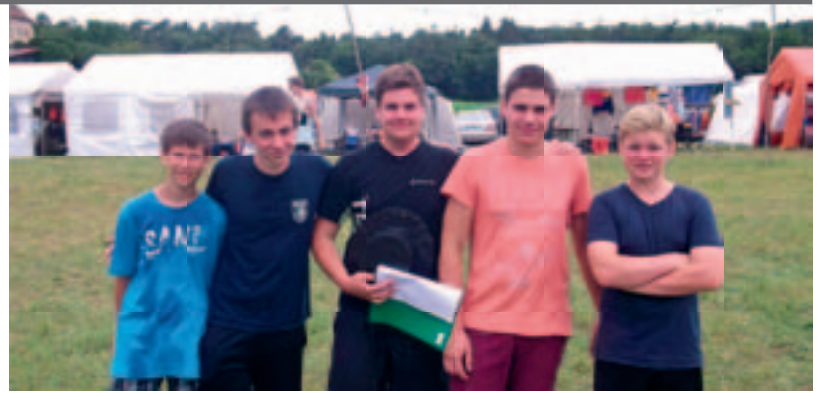
Erster Preis Bootsregatta, wir kommen ja auch vom Mee!

Im Übrigen können auch Mütter, die zwei vor 1992 geborene Kinder haben, eine Altersrente bekommen, wenn sie noch freiwillige Beiträge nachzahlen. Dazu sollten sie sich vom Rentenversicherungsträger beraten lassen. Auch für Frauen, die ansonsten in der Alterssicherung der Landwirte (AdL) versichert sind, werden Kindererziehungszeiten nur in der gesetzlichen Rentenversicherung berücksichtigt. Deshalb sollte der Antrag bei der Deutschen Rentenversicherung gestellt werden.