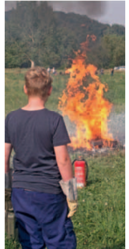
Vorsicht! Heiss und fettig!