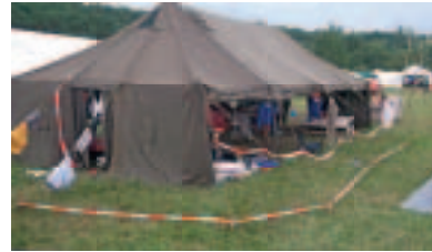
Unser Zelt ist eines der letzten seiner Art, aber schon wieder cool.