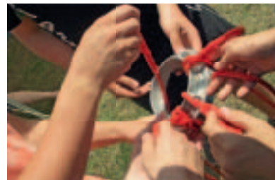
Schon wieder gestochener Mastwurf!